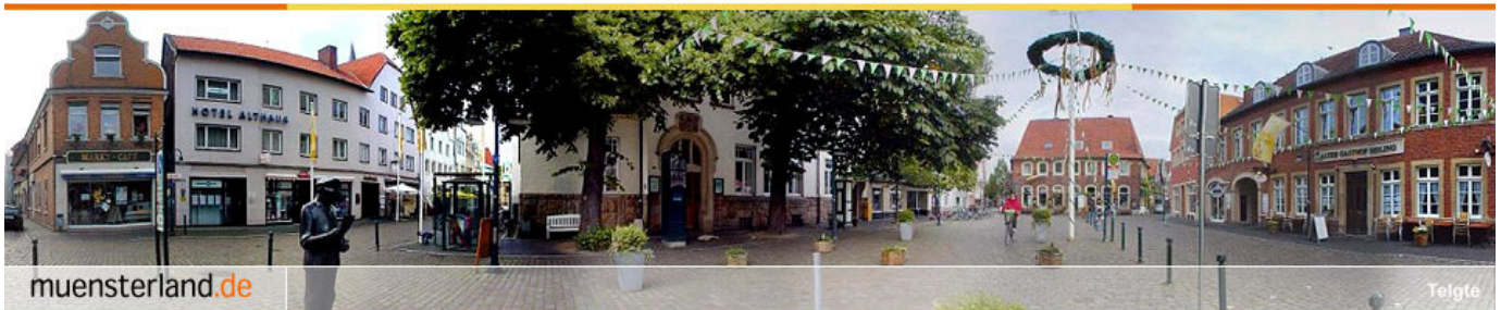
Der Telgter Marktplatz